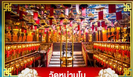
วัดมานโม

ปักใจกลาง "จับจ่าย" บินหรือลองเทศกาลปีใหม่ ณ เกาะฮ่องกง