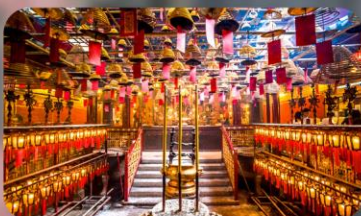
วัดหม่านโม