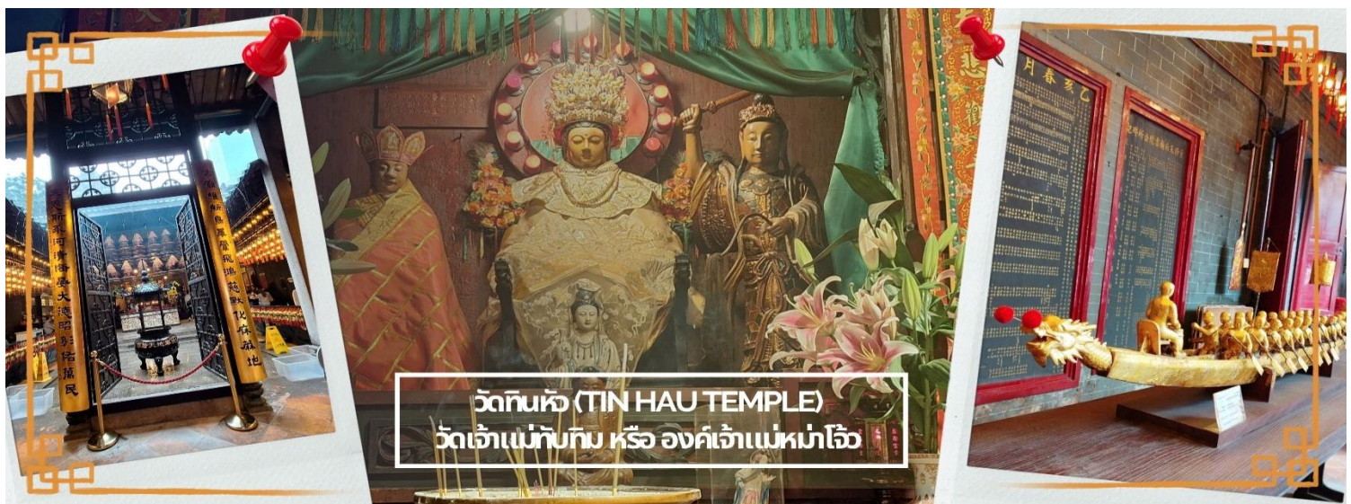
วัดทินหัว (TIN HAU TEMPLE) วัดเจ้าแม่ทับทิม หรือ องค์เจ้าแม่หม่าโจ้ว

จากนั้นนำท่าน ไหว้ขอพรเรื่องเดินทาง การติดต่อ ค้าขาย วัดเจ้าแม่ทับทิมทินหัว (Tin Hau Temple) ที่ Yau Ma Tei เป็นวัดเก่าแก่ขนาดเล็ก อายุกว่า 150 ปี มีต้นกำเนิดมาจากวัดเล็กๆ ใน พื้นที่ตลาด Kwun Chung เคยเป็นหมู่บ้านชาวประมงมาก่อน ตั้งแต่ปี 1864 เป็นวัดที่อุทิศให้กับทินโหว่ (หมาโจ้ว เทพเจ้าแห่งท้องทะเล) มีบรรยากาศที่สงบ ร่มรื่น ติดกับสวนสาธารณะเล็ก ๆ และนักท่องเที่ยวยังไม่พรั่งพร้อมมากจุดเด่นที่แนะนำคือ การปิดทองเรือมังกร เพื่อการงานการค้า ธุรกิจ ให้เจริญรุ่งเรือง