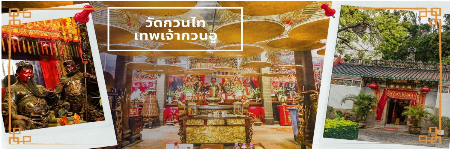
วัดกวนโต เทพเจ้ากวนอู

จากนั้นนำท่าน ไหว้ขอพรเรื่องเดินทาง การติดต่อ ค้าขาย วัดเจ้าแม่ทับทิมทินหัว (Tin Hau Temple) ที่ Yau Ma Tei เป็นวัดเก่าแก่ขนาดเล็ก อายุกว่า 150 ปี มีต้นกำเนิดมาจากวัดเล็กๆ ใน พื้นที่ตลาด Kwun Chung เคยเป็นหมู่บ้านชาวประมงมาก่อน ตั้งแต่ปี 1864 เป็นวัดที่อุทิศให้กับทินโหว่ (หมาโจ้ว เทพเจ้าแห่งท้องทะเล) มีบรรยากาศที่สงบ ร่มรื่น ติดกับสวนสาธารณะเล็ก ๆ และนักท่องเที่ยวยังไม่พรั่งพร้อมมากจุดเด่นที่แนะนำคือ การปิดทองเรือมังกร เพื่อการงานการค้า ธุรกิจ ให้เจริญรุ่งเรือง