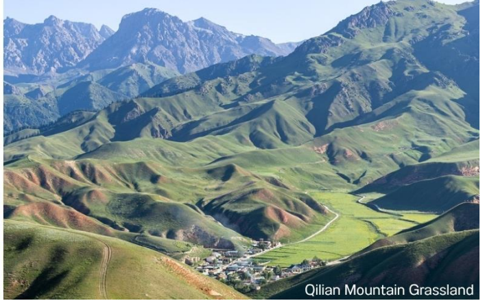
Qilian Mountain Grassland