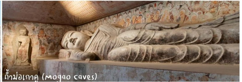
ถ้ำม่อเกาคุ (Mogao caves)

ค่ำ บริการอาหารค่ำ ณ ภัตตาคาร ที่พัก CASTLE HOTEL 4* หรือเทียบเท่า