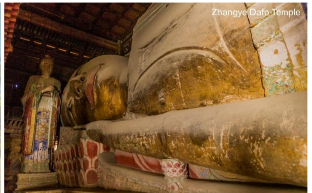
Zhangye Dafo Temple

จากนั้นนำท่านสู่ อุทยานธรณีแห่งชาติจางเย่ (Zhangye National Geopark) ซึ่งเป็นที่ตั้งของ "ภูเขาสายรุ้ง" หรือแนวเขาที่มีลวดลายสีสันทัดตามธรรมชาติ นำท่านเข้าชม ภูเขาสายรุ้งจางเย่ต้นเซีย (Zhangye Danxia Landform): จุดเช็คอินยอดนิยมที่มีภูเขาหินทรายหลากสีสันทัดเป็นริ้วสวยงาม จนได้รับการขนานนามว่าเป็น "ภูเขาสายรุ้งแห่งแดนเหนือ" นำท่านชม ภูเขาสายรุ้งจางเย่ต้นเซีย (Zhangye Danxia Landform) (รวมรถในอุทยาน) จุดเช็คอินยอดนิยมที่มีภูเขาหินทรายหลากสีสันทัดเป็นริ้วสวยงาม จนได้รับการขนานนามว่าเป็น "ภูเขาสายรุ้งแห่งแดนเหนือ" ตั้งอยู่ในมณฑลกานซู ประเทศจีน เป็นอุทยานธรณีแห่งชาติที่ขึ้นชื่อเรื่องแนวเขาหินทรายและแร่ธาตุสีสันทัดสดใสคล้ายสายรุ้ง เกิดจากการทับถมและเคลื่อนตัวของเปลือกโลกนานกว่า 24 ล้านปี สวยงามระดับโลก UNESCO เป็นแนวเขาสีแดง ส้ม เหลือง ขาว และน้ำตาล สลับกัน เกิดจากตะกอนหินทรายและแร่ธาตุต่างๆ ทับถม