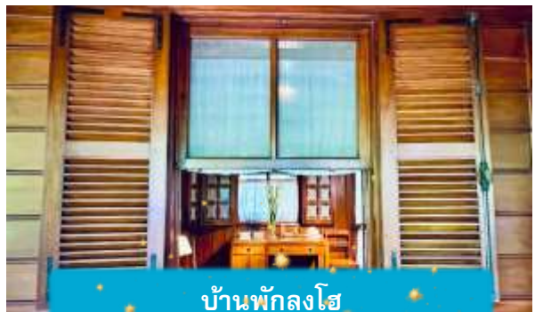
บ้านพักลุงโฮ