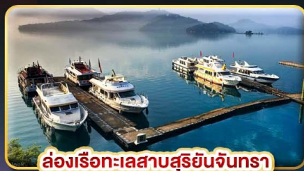
ล่องเรือทะเลสาบสุริยอันจินตรา