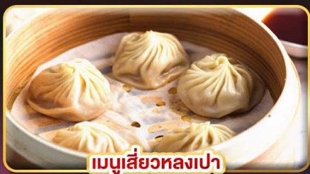
เมนูเสี่ยวหลงเปา