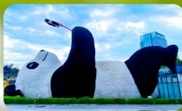
หมีแพนด้าเซลฟ์