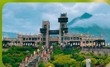
หมู่บ้านโบราณชนเผ่าเซียง