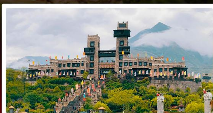
หมู่บ้านโบราณชนเผ่าเซียง