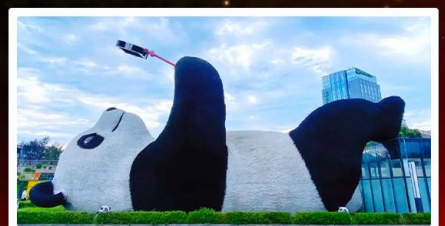
หมีแพนด้าเซลฟี