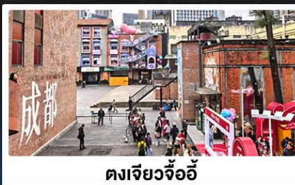
ตงเจียงจ้ออ๋