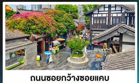
ถนนชอยกวางชอยแคว