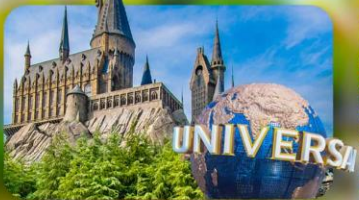
เลือกอิสระ Universal Studios Japan