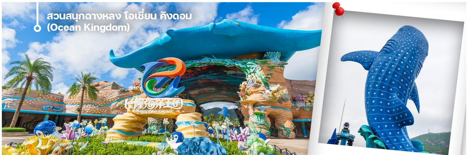
สวนสนุกฉางหลง โอเชียน คิงดอม (Ocean Kingdom)

นำท่านเดินทางสู่ CHIMLONG PARK สวนสนุกขนาดใหญ่ CHIMELONG OCEAN KINGDOM (รวมบัตรค่าเข้าและเครื่องเล่นแล้ว) ผจญภัย 8 โลกแห่งมหาสมุทร Chimelong Ocean Kingdom สวนสนุกและอควาเรียมระดับโลกแห่งเมืองจูไห่ ประเทศจีน คือสวรรค์ของคนรักทะเลและธรรมชาติ ที่นี่ไม่ได้มีแค่สัตว์น้ำ แต่ยังรวมเครื่องเล่นสุดล้ำ การแสดงระดับนานาชาติ และซีมพาร์คที่จัดอย่างพิถีพิถันตามแนวคิด “โลกใต้น้ำ” แบ่งออกเป็น 8 โซนหลัก ที่แต่ละแห่งล้วนมีเอกลักษณ์เฉพาะตัวไม่เหมือนใคร