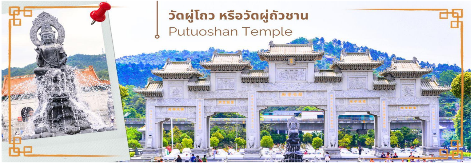
วัดผู้โถว หรือวัดผู้ถวซาน Putuoshan Temple

นำท่านเดินทางสู่ CHIMLONG PARK สวนสนุกขนาดใหญ่ CHIMELONG OCEAN KINGDOM (รวมบัตรค่าเข้าและเครื่องเล่นแล้ว) ผจญภัย 8 โลกแห่งมหาสมุทร Chimelong Ocean Kingdom สวนสนุกและอควาเรียมระดับโลกแห่งเมืองจูไห่ ประเทศจีน คือสวรรค์ของคนรักทะเลและธรรมชาติ ที่นี่ไม่ได้มีแค่สัตว์น้ำ แต่ยังรวมเครื่องเล่นสุดล้ำ การแสดงระดับนานาชาติ และซีมพาร์คที่จัดอย่างพิถีพิถันตามแนวคิด “โลกใต้น้ำ” แบ่งออกเป็น 8 โซนหลัก ที่แต่ละแห่งล้วนมีเอกลักษณ์เฉพาะตัวไม่เหมือนใคร