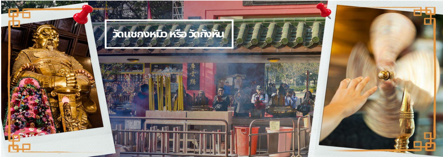
วัดเขกงหมือ หรือ วัดกิงหัน

จากนั้นเดินทางสู่แหล่งช้อปปิ้ง ย่านจิมซาจู้ (TSIM SHA TSUI) สัมผัสบรรยากาศร้านเสื้อผ้า ร้านอาหาร และร้านขายเครื่องประดับที่แข่งกันเรียกลูกค้าตลอดแนวถนนที่มีทั้งสินค้าหรูหราและอุปกรณ์อิเล็กทรอนิกส์ ตั้งอยู่บนถนนนาธาน ถนนทอดยาวตั้งแต่ จิมซาจู้ จนถึงย่าน ปรีนซ์เอ็ดเวิร์ด เต็มไปด้วยร้านค้าต่างๆมากมายทั้งเสื้อผ้าแบรนด์เนมระดับ HI-END ชื่อดังทั่วโลก ห้างสรรพสินค้าที่ทันสมัย จากถนนนาธานไปที่ถนนแคนตัน ท่านจะตื่นตาตื่นใจไปกับเอาท์เล็ตแบรนด์ที่เรียงติดกันเป็นแถบ นอกจากนี้ยังมี HARBOUR CITY ศูนย์การค้ายักษ์ใหญ่ของฮ่องกง ซึ่งมีร้านค้ากว่า 450 ร้านรวมอยู่ที่นี่ และมี SHOPPING COMPLEX ขนาดใหญ่ชื่อ OCEAN TERMINAL ซึ่งประกอบไปด้วยห้างสรรพสินค้าเรียงรายกันอยู่และมีทางเชื่อมติดต่อกันสามารถเดินทะลุถึงกันได้ให้แบรนด์ดังมากมายให้ท่านได้เลือกซื้อ หรือจะชมวิวของอ่าววิกตอเรีย เดินเล่นบริเวณใกล้ๆ จิมซาจู้เริ่มต้นจากหอนาฬิกาสมัยอาณานิคม แถวนี้มีทัศนียภาพที่สวยงามที่สุดแห่งหนึ่งสำหรับการชมวิวตามแนวท่าเรือของเกาะฮ่องกง เป็นตัวเลือกให้ท่านไปเยี่ยมชมอีกด้วย สมควรแก่เวลานำคณะออกเดินทางสู่สนามบินฮ่องกง