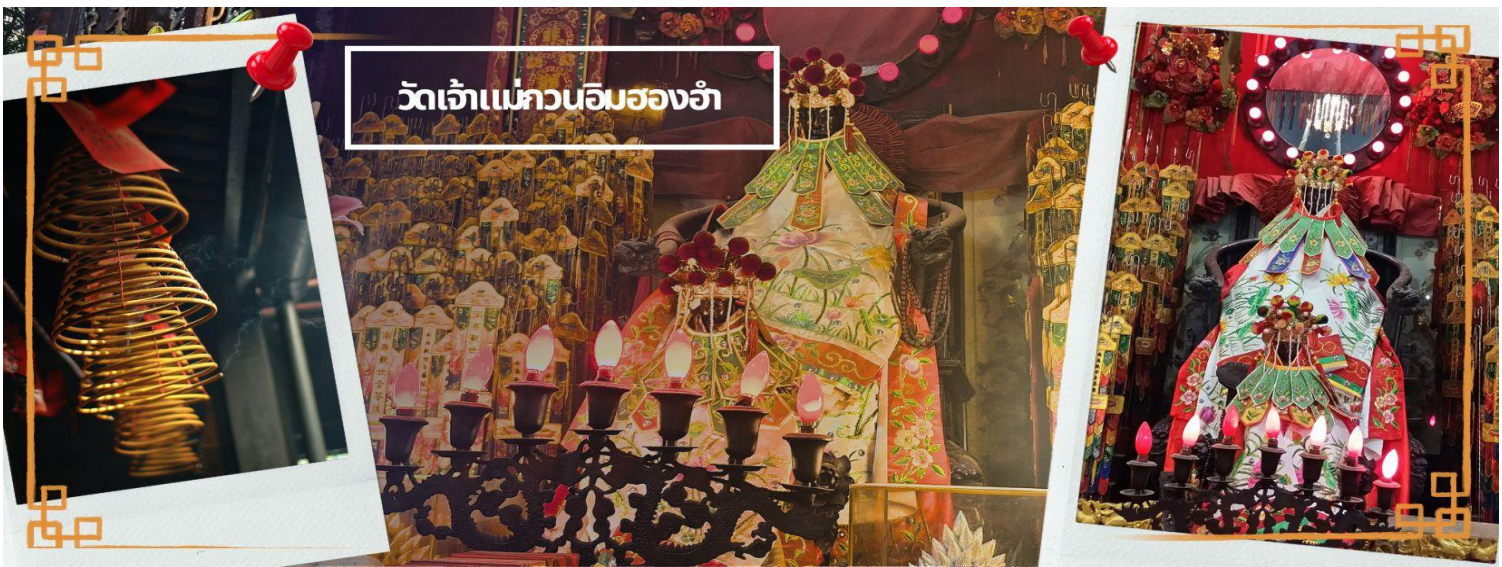
วัดเจ้าแม่กวนอิมว่องอ่า

จากนั้นนำท่านชม โรงงานจิ๋วเวอรี่ ซึ่งเป็นโรงงานที่มีชื่อเสียงที่สุดของฮ่องกงในเรื่องการออกแบบเครื่องประดับ อาทิ เช่น จี้ และแหวนกำหันทน์ ที่สวยงามโดดเด่นไม่เหมือนใคร ซึ่งถือกำเนิดขึ้นที่นี่และมีชื่อเสียงที่สุดใช้เป็นเครื่องประดับติดตัว และเสริมดวงชะตา สินค้าทุกชิ้นมีเอกสารรับประกันคุณภาพเปลี่ยน ซ่อม ได้ตลอดอายุการใช้งาน หากเกิดการชำรุดจากสินค้าไม่ใช่อุบัติเหตุ