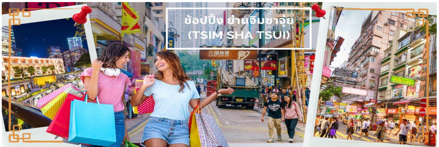
ช้อปปิ้ง ย่านจิมซาจู้ (TSIM SHA TSUI)

จากนั้นเดินทางสู่แหล่งช้อปปิ้ง ย่านจิมซาจู้ (TSIM SHA TSUI) สัมผัสบรรยากาศร้านเสื้อผ้า ร้านอาหาร และร้านขายเครื่องประดับที่แข่งกันเรียกลูกค้าตลอดแนวถนนที่มีทั้งสินค้าหรูหราและอุปกรณ์อิเล็กทรอนิกส์ ตั้งอยู่บนถนนนาธาน ถนนทอดยาวตั้งแต่ จิมซาจู้ จนถึงย่าน ปรีนซ์เอ็ดเวิร์ด เต็มไปด้วยร้านค้าต่างๆมากมายทั้งเสื้อผ้าแบรนด์เนมระดับ HI-END ชื่อดังทั่วโลก ห้างสรรพสินค้าที่ทันสมัย จากถนนนาธานไปที่ถนนแคนตัน ท่านจะตื่นตาตื่นใจไปกับเอาท์เล็ตแบรนด์ที่เรียงติดกันเป็นแถบ นอกจากนี้ยังมี HARBOUR CITY ศูนย์การค้ายักษ์ใหญ่ของฮ่องกง ซึ่งมีร้านค้ากว่า 450 ร้านรวมอยู่ที่นี่ และมี SHOPPING COMPLEX ขนาดใหญ่ชื่อ OCEAN TERMINAL ซึ่งประกอบไปด้วยห้างสรรพสินค้าเรียงรายกันอยู่และมีทางเชื่อมติดต่อกันสามารถเดินทะลุถึงกันได้ให้แบรนด์ดังมากมายให้ท่านได้เลือกซื้อ หรือจะชมวิวของอ่าววิกตอเรีย เดินเล่นบริเวณใกล้ๆ จิมซาจู้เริ่มต้นจากหอนาฬิกาสมัยอาณานิคม แถวนี้มีทัศนียภาพที่สวยงามที่สุดแห่งหนึ่งสำหรับการชมวิวตามแนวท่าเรือของเกาะฮ่องกง เป็นตัวเลือกให้ท่านไปเยี่ยมชมอีกด้วย สมควรแก่เวลานำคณะออกเดินทางสู่สนามบินฮ่องกง