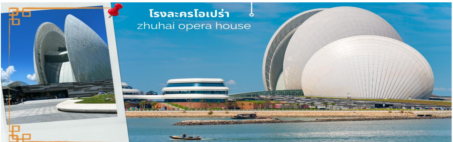
โรงละครโอเปร่า zhuhai opera house

จากนั้นนำท่านสู่ ร้านหยก หยกในจีนโบราณจนมาถึงสมัยนี้ ยังมีความเชื่อว่าเป็นอัญมณีที่ล้ำค่าและหายาก บ่งบอกฐานะของสตรีในสมัยก่อน แต่ในสมัยนี้ เชื่อกันว่าหยกสีเขียวนั้นเหนียวนำโชคและความร่ำรวย ดังคำกล่าวที่ว่า “สีเขียวเหนียวทรัพย์” ถือเป็นการเสริมฮวงจุ้ยที่ดีของผู้สวมใส่อิสระให้ท่านได้เรียนรู้ชนิดของหยกและเลือกซื้อตามใจชอบ และนำท่านแะ ร้านผ้าไหม เป็นอีกสินค้าของฝาก ให้ชมความละเอียดอ่อนของผ้าไหม และเลือกซื้อสินค้าที่จากผ้าไหมที่มีเนื้อผ้าอันละเอียดอ่อน เช่น ผ้าห่ม เสื้อผ้า รองเท้า และอื่นๆ นำท่านถ่ายรูปด้านหน้า โรงละครไข่มุก (Zhuhai Opera House) หนึ่งในแลนด์มาร์กของเมืองจูไห่ มีลักษณะทางสถาปัตยกรรมที่โดดเด่น ล้ำยุคและทันสมัย โดยมีการออกแบบเป็นรูปทรงเปลือกหอยประกบกัน ที่ดูเก๋ไปรุ่งใสในตอนกลางวัน และดูใสราวกับแสงจันทร์ในยามค่ำคืน ซึ่งด้วยเหตุนี้จึงเป็นที่มาให้กับชื่อเรียกของเปลือกหอยอันเล็กกว่า “เปลือกหอยดวงจันทร์” โดยเป็นโรงละครที่สามารถรองรับผู้เข้าชมได้ 500