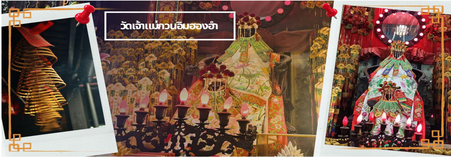
วัดเจ้าแม่กวนอิมฮ่องงำ

จากนั้นนำท่านชม โรงงานจิ๋วเวอรี่ ซึ่งเป็นโรงงานที่มีชื่อเสียงที่สุดของฮ่องกงในเรื่องการออกแบบเครื่องประดับ อาทิเช่น จี้ และแหวนกำหันทน์ ที่สวยงามโดดเด่นไม่เหมือนใคร ซึ่งถือกำเนิดขึ้นที่นี่และมีชื่อเสียงที่สุดใช้เป็นเครื่องประดับติดตัว และเสริมดวงชะตา สินค้าทุกชิ้นมีเอกสารรับประกันคุณภาพเปลี่ยน ซ่อม ด้ตลอดอายุการใช้งาน หากเกิดการชำรุดจากสินค้า ไม่ใช่อุบัติเหตุ