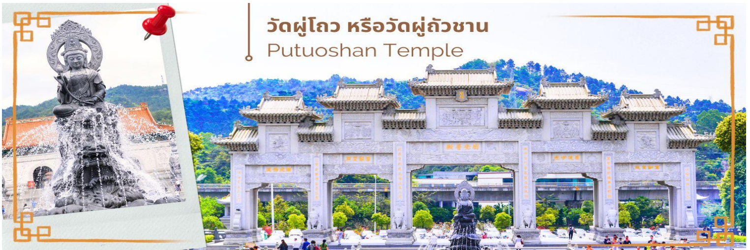
วัดผู่โถว หรือวัดผู่ถ้วซาน Putuoshan Temple

จากนั้นนำท่านสู่ วัดผู่โถว หรือวัดผู่ถ้วซาน (Putuoshan Temple) ดินแดนอันศักดิ์สิทธิ์ ของพระโพธิสัตว์กวนอิม พุทธศาสนิกายมหายาน พระโพธิสัตว์กวนอิมคืออวตารหนึ่งของพระอมิตาภพุทธเจ้า ซึ่งพระโพธิสัตว์กวนอิม เป็นมหาบุรุษมีวัณธรรมโดยรวมกว้างขวางและออกแบบด้วยรูปแบบสถาปัตยกรรมโบราณแบบดั้งเดิม ที่จำลอง มาจากเกาะผู่ถ้วซาน ลงมาสู่ดินแดนแห่งท้องทะเลใต้ แห่งนี้