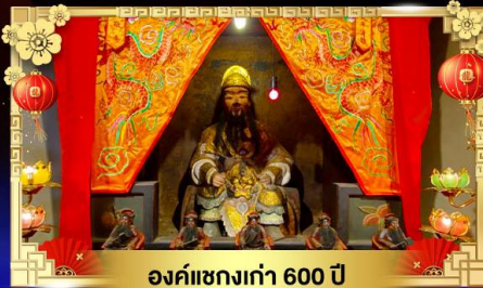
องค์แซกงเก่า 600 ปี