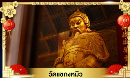
วัดแซกงหมิว

หมูนกั้งหันนำโชควัดแซกง ส่วนสนุกตีสนีย์แลนด์เต็มวัน