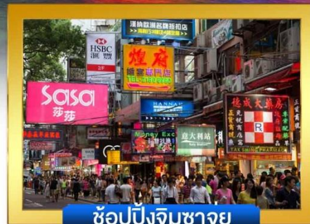
ช้อปปิ้งจิมซาจุ่ย