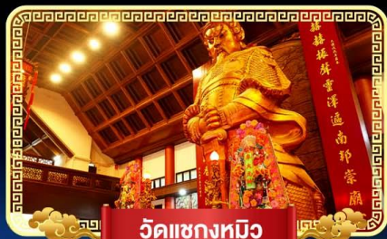
วัดเข่งหมิว