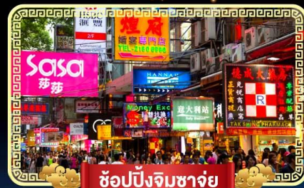
ช้อปปิ้งจิมซาจู้