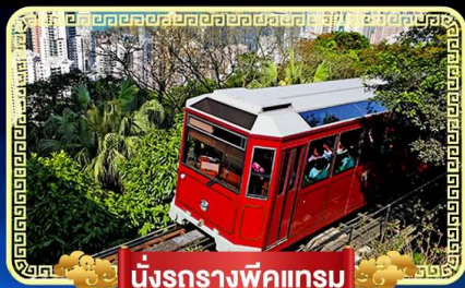
นั่งรถรางพิกเกรม