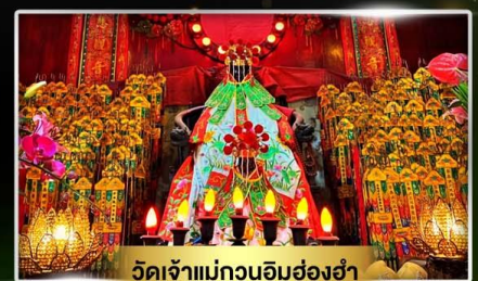
วัดเจ้าแม่กวนอิมฮ่องฮ่า