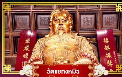
วัดเขกทมิว