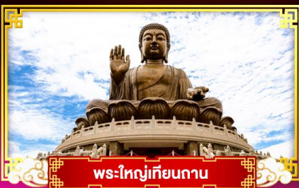
พระใหญ่เทียนถาน

เที่ยว..สวนสนุกดิสนีย์แลนด์ นั่งรถรางพิกแตรม ขึ้นกระเช้ามองปิง 360 องศา