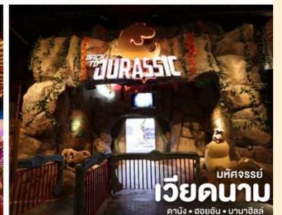
มัทศจรรย์ เวียดนาม ดานัง • ฮอยอัน • บานาฮิลล์