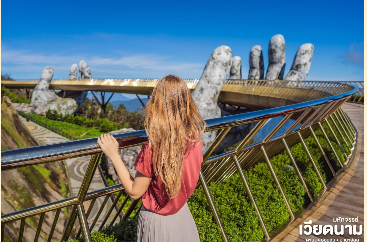
มัทศจรรย์ เวียดนาม ดานัง • ฮอยอัน • บานาฮิลล์

นำท่านชม สะพานสีทอง สถานที่ ท่องเที่ยวใหม่ล่าสุดตั้งโดดเด่น เป็นเอกลักษณ์อย่างสวยงาม บน เขาบานาฮิลล์ นำท่านสู่จุดที่สร้าง ความตื่นเต้นให้นักท่องเที่ยว มองดูอย่างอลังการที่ซึ่งเต็มไปด้วย เสน่ห์แห่งตำนานและ จินตนาการของการผจญภัยที่ สวนสนุก The Fantasy Park (รวมค่าเครื่องเล่นบนสวนสนุก ยกเว้น หุ่นขี้ผึ้ง โรงบ่มไวน์ และ รถไฟเหาะ Alpine Coaster ที่ไม่รวมให้ในรายการ) ที่เป็นส่วน หนึ่งของบานาฮิลล์ท่านจะ ได้พบกับเครื่องเล่นในหลายรูปแบบเช่นทำทนายความมันส์ของหนัง 4D,