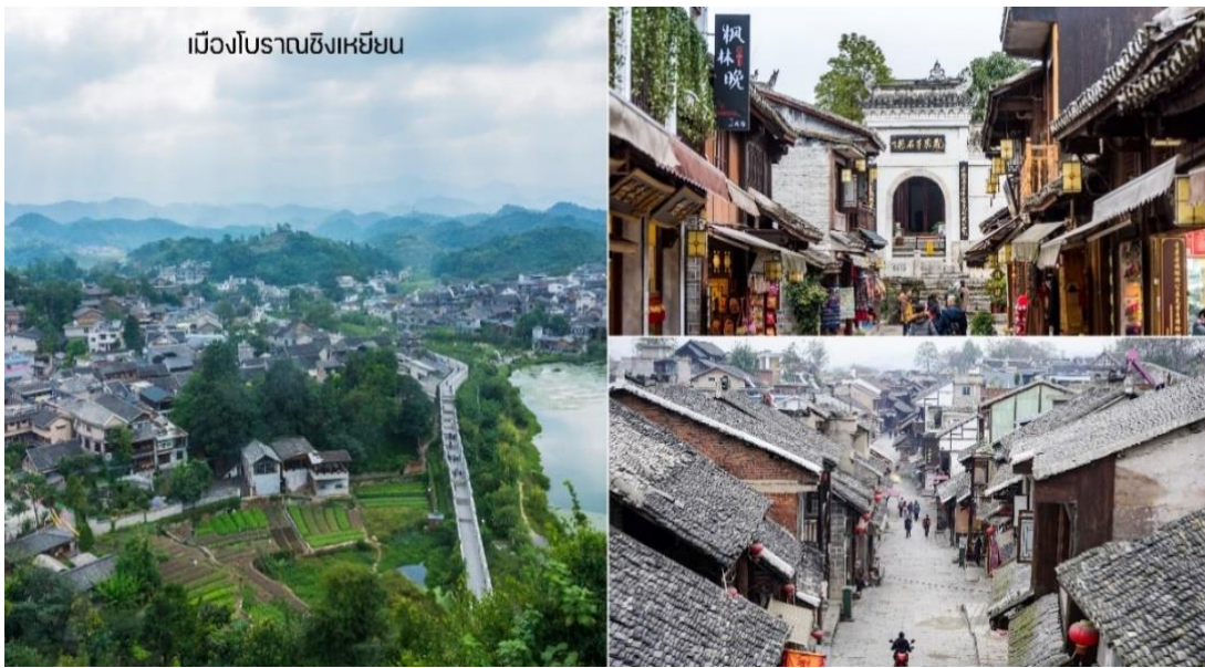
เมืองโบราณชิงหยียน

นำท่านสู่ เมืองโบราณชิงหยียน(รวมรถแบคเตอร์) ในเมืองกุ้ยหยางชวนชมภาพถ่ายของอาณาจักรเมืองโบราณชิงหยาน ในเมืองกุ้ยหยาง เมืองเอกของมณฑลกุ้ยโจว ทางภาคตะวันตกเฉียงใต้ของจีน โดยเมืองโบราณแห่งนี้สร้างขึ้นในสมัย จักรพรรดิหงอู่แห่งราชวงศ์หมิงบรรยากาศหมู่บ้านดั้งเดิมที่งดงามร่มรื่น ดึงดูดนักท่องเที่ยวจำนวนมาก