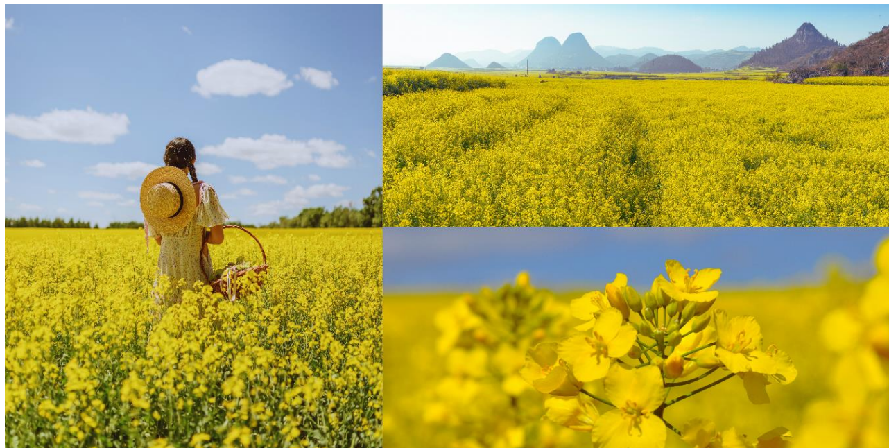
กำลังผลิตดอกบาน จนกลายเป็นคางความงดงามที่คนจีนเองยังนิยมชมชอบ (รวมรถแบตเตอรี่)

นำท่านชมทุ่งดอกเรพชิต มีพื้นที่ 200,000 ไร่ สีเหลืองอร่ามไปทั่วขุนเขาสุดลูกหูลูกตา ทุ่งดอกมัสตาร์ด หรือ ดอกอี๊วไซฮั่ว คือดอกน้ำมันที่นำไปสกัดเป็นน้ำมันพืชที่ใช้บริโภคในเมืองโหลผิงและเมืองใกล้เคียง ส่วนยอดอ่อนก็นำไป ทำอาหารได้รสชาติก็ใกล้เคียงกับผักกวางตุ้ง ช่วงเดือนกุมภาพันธ์ถึงเดือนมีนาคม จะเป็นช่วงฤดูกาลเพาะปลูกอี๊วไซฮั่ว และเป็นช่วงที่