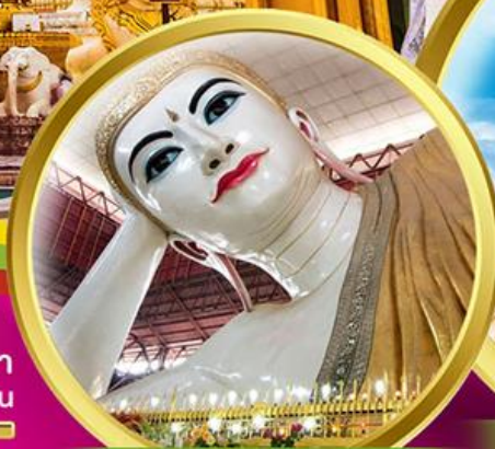
พระนอนตาวาน