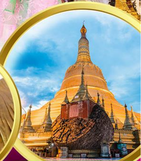
เจดีย์ชเวดากอง

พิเศษ!! กุ้งแม่น้ำเผาท่านละ 1 ตัว + บุฟเฟ่ต์HOTPOT