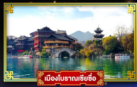
เมืองโบราณเซี่ยซือ