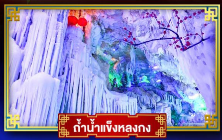
ถ้ำน้ำแข็งหลงกง

"เที่ยว 2 มณฑล กวางซี-ก๊วยโจว" สุดอลังการ น้ำตก 2 พรมแดน แหล่งท่องเที่ยวระดับ 5A