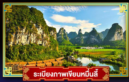
ระเบียบภาพเขียนหมื่นลี้