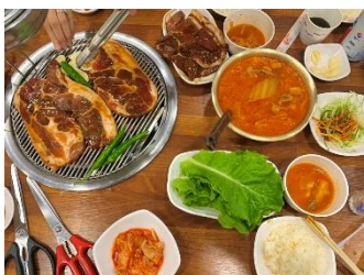
รับประทานอาหารเช้าที่โรงแรมที่พัก เป็นสไตล์บุฟเฟ่ต์แบบฉบับเกาหลี

วันทของการเดินทาง ศูนย์แสดงชุดเครื่องนอน SESA LIVING - ศูนย์เครื่องสำอางค์เมืองปูซาน - ลีตเต็วดีตี้ฟรี่ปูซาน - ตลาดวอลล์กิงสตรีทนมโพดง - ตลาดปลาจากัลชึ - หมู่บ้านวัฒนธรรมคัมซอน