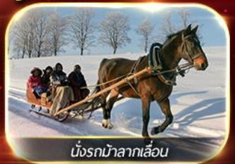
นั่งรถม้าลากเลื่อน

ฟรีนั่งรถม้าลากเลื่อน ชมโชว์ว่ายน้ำแข็ง แม่น้ำชงหวาเจียง