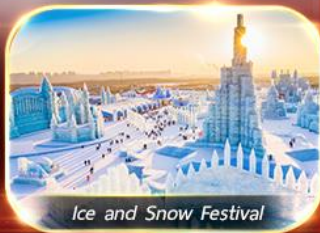
Ice and Snow Festival