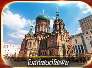
โบสถ์เซนต์โซเฟีย