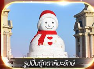
หมู่บ้านตุ๊กตาหิมะยักษ์