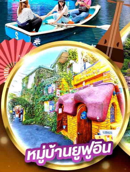
หมู่บ้านยูฟูอิน