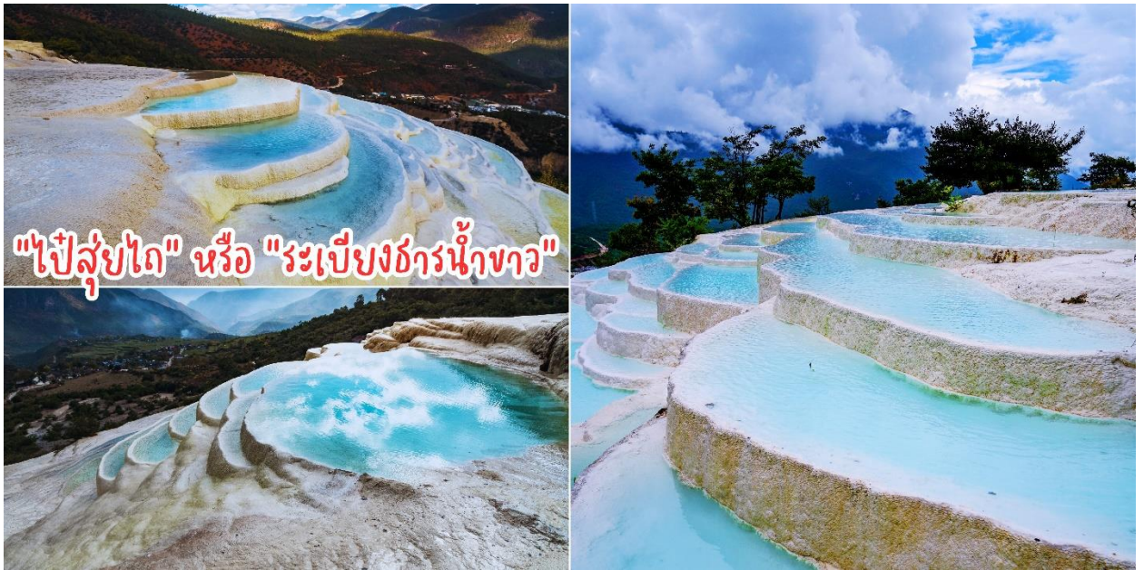
"ไป๋ส่วยโต" หรือ "ระเปียงธาร์น้ำจาว"