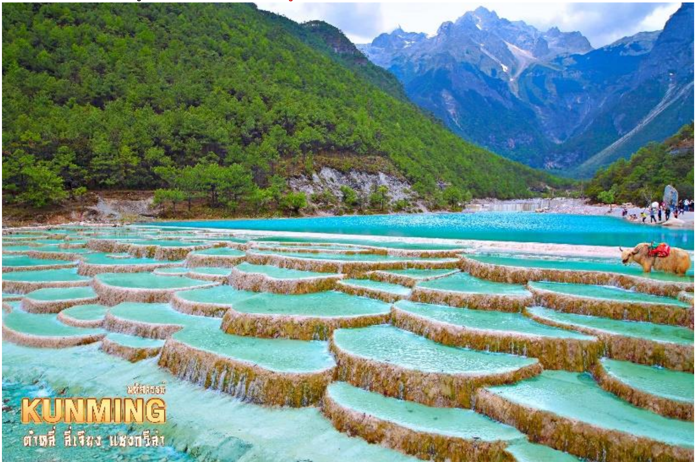
มหัสจรรย์ KUNMING ต้าชี่ สีเจียง แซงกรี่ล่า

ชมความงดงามผืนน้ำสีเทอควยซ์ของ ทะเลสาบไป๋สฺยเหอ ทะเลสาบที่อยู่อีกด้านหนึ่งของภูเขาหิมะมังกรหยก น้ำในทะเลสาบแห่งนี้ไหลลงมาจากการละลายของหิมะบนภูเขาหิมะมังกรหยก สามารถดื่มชมความสวยของทะเลสาบได้ตลอดระยะทาง 3 กิโลเมตร หรือจะเลือกนั่งรถรับส่งได้ตามสะดวกไปยังจุดท่องเที่ยวยอดนิยม ( รวมค่ารถแบดเตอร์ ) ระหว่างทางเดินเลียบทะเลสาบจะพบเห็นคู่รักชาวจีนที่นิยมมาถ่ายพีริเวดดิ้ง และมีเจ้าหน้าที่คอยพาจามริมาบริการให้นักท่องเที่ยวได้ถ่ายรูป ( ไม่รวมค่าบริการถ่ายรูป ราคาประมาณ 50 หยวน )