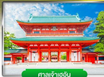
ศาลเจ้าเฮอัน