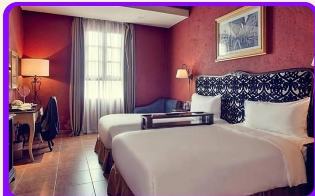
พักบนบานาฮิลล์ 1 คืน