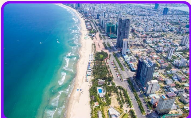
เซ็คอิน ชายหาดหมีเคว เป็นชายหาดที่สวยงามที่สุดในเมืองดานัง