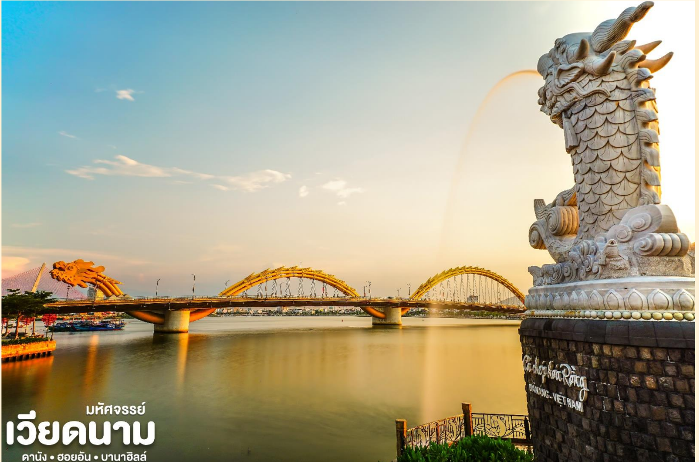
มหัศจรรย์ เวียดนาม ดานัง • ฮอยอัน • บานาฮิลล์

จากนั้น นำท่านสู่ ร้านหยก ให้ท่านเลือกชมและซื้อของฝากเป็นที่ระลึก และนำท่านชม สะพานมังกร Dragon Bridge อีกหนึ่งที่เที่ยวดานังแห่งใหม่สะพานมังกรไฟสัญลักษณ์ความสำเร็จแห่งใหม่ของเวียดนาม ที่มีความยาว 666 เมตร ความกว้างเท่าถนน 6 เลนส์ เชื่อมต่อสองฟากฝั่งของแม่น้ำฮัน ประเทศเวียดนามสะพานมังกรถูกสร้างขึ้นเพื่อเป็นแหล่งท่องเที่ยวดานัง เป็นสัญลักษณ์ของการฟื้นคืนประเทศ และเป็นการฟื้นฟูเศรษฐกิจของประเทศ โดยได้เปิดใช้งานตั้งแต่ปี 2013 ด้วยสถาปัตยกรรมที่บวกกับเทคโนโลยีสมัยใหม่ที่ได้รับแรงบันดาลใจจากตำนานของเวียดนามเมื่อกว่าหนึ่งพันปีมาแล้ว