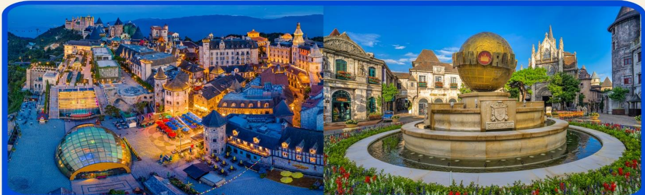
พักผ่อน บานาฮิลล์ 1 คืน