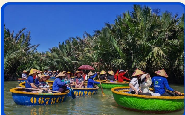
พิเศษ !!! นั่งเรือกระด้ง UNSEEN เวียดนาม