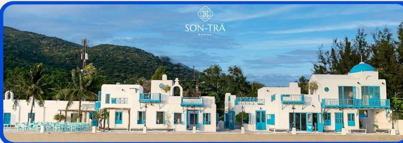
เช็คอินคาเฟ่ SON TRA MARINA