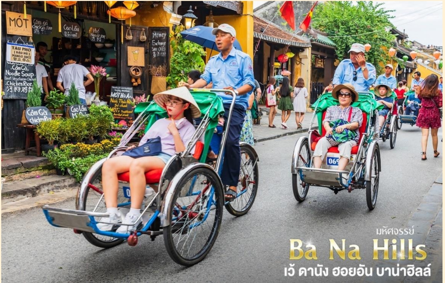
มหัศจรรย์ Ba Na Hills เว้ คานิง ฮอยอัน บาน่าฮิลล์

(ไม่รวมค่าทิปคนขี่สามล้อ ท่านละ 40 บาท/ต่อท่าน/ต่อทริป)