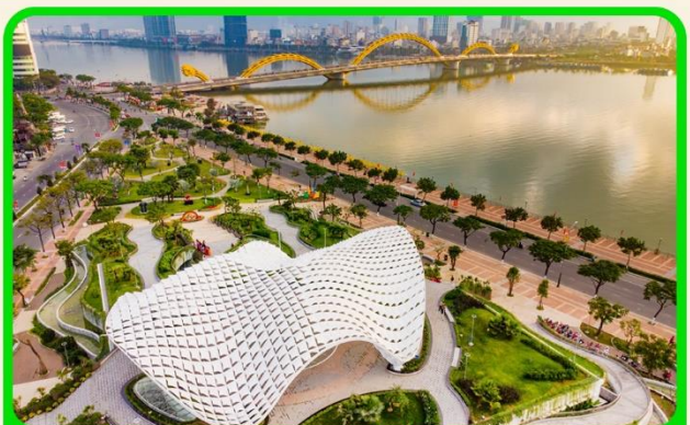
เช็คอน แหล่งที่เที่ยงใหม่ APEC PARK