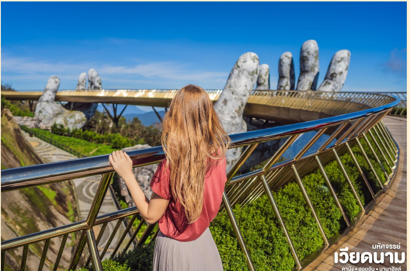
มหัศจรรย์ เวียดนาม ดานัง • ฮอยอัน • บานาฮิลล์

กว่าจะเข้าพร้อมอากาศบริสุทธิ์อันสดชื่นจนทำให้ท่านอาจลืมไปเสียด้วยซ้ำว่าที่นี่ไม่ใช่ยุโรป เพราะอากาศที่หนาวเย็นเฉลี่ยตลอดทั้งปีประมาณ 10 องศาเท่านั้นจุดที่สูงที่สุดของบานาฮิลล์มีความสูง 1,467 เมตรกับสภาพผืนป่าที่อุดมสมบูรณ์ นำท่านชม สะพานสีทอง สถานที่ท่องเที่ยวใหม่ล่าสุดตั้งโดดเด่นเป็นเอกลักษณ์อย่างสวยงาม บนเขาบานาฮิลล์