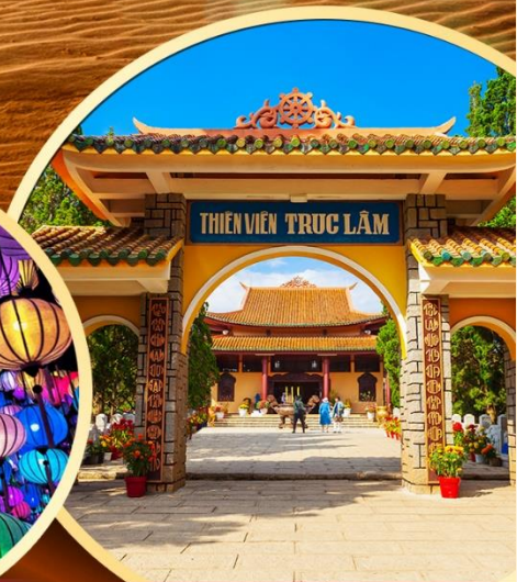
วัดตักลัม