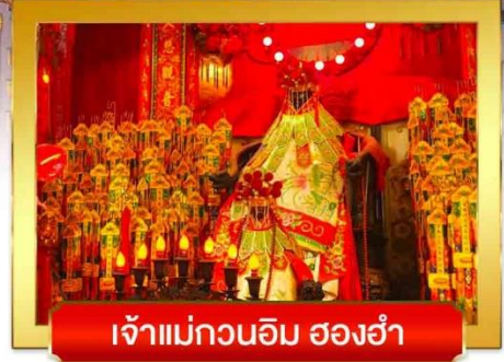
เจ้าแม่กวนอิม ฮ่องฮำ