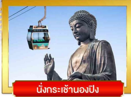
นั่งกระเช้ามองปิง