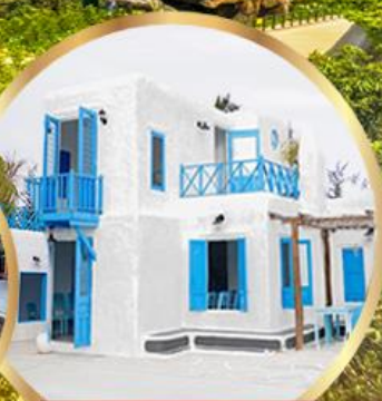
มารีน่า คาเฟ่