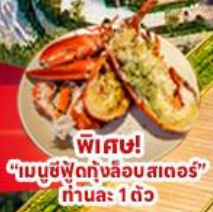
พิเศษ! “เมนูซีฟู้ดกุ้งลือบสเตอร์” ท่านละ 1 ตัว

พัก Bana Hill 1 คืน พัก ดานัง 4 ดาว 2 คืน