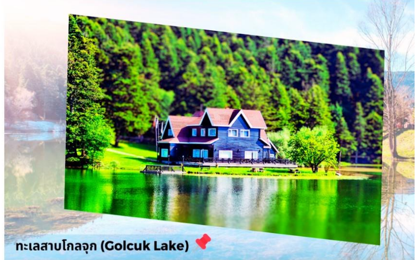
ทะเลสาบโกลจุก (Golcuk Lake)

ทะเลสาบน้ำจืดที่สวยงาม เปรียบเสมือน ภาพวาดที่มีบ้านไม้อยู่ตรงกลางทะเลสาบ จุดหมายปลายทางยอดนิยมในหมู่นักท่องเที่ยว เที่ยวได้พักผ่อนและใช้เวลาท่ามกลาง ธรรมชาติให้ท่านสามารถเดินเล่นในที่ที่มี อากาศบริสุทธิ์ พร้อมชมความงามของ ทะเลสาบและให้ได้เก็บภาพบรรยากาศ รอบๆ