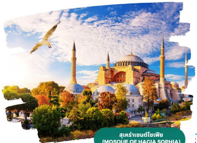
สุเหร่าเซนต์โซเฟีย (MOSQUE OF HAGIA SOPHIA)

สุเหร่าเซนต์โซเฟีย (MOSQUE OF HAGIA SOPHIA) หรือวิหารเซนต์โซเฟีย หรือ HAGHIA SOFIA (ฮายาโซฟีอา) แปลว่า โบสถ์แห่งปัญญา อันศักดิ์สิทธิ์ วิหารแห่งนี้เคยเป็นโบสถ์ของศาสนาคริสต์มากกว่า 900 ปี สร้างในสมัยของจักรพรรดิจัสติเนียน แห่งจักรวรรดิไบแซนไทน์ มีลักษณะแบบผสมผสาน ระหว่าง ศิลปวัฒนธรรมกรีก โรมัน และเปอร์เซีย จุดเด่นคือ โดมขนาดใหญ่เป็นอันดับ 4 ของโลก ก่อสร้างด้วยการใช้ผนังเป็นตัวรับน้ำหนักของอาคารลงสู่พื้นแทนการใช้เสาค้ำยัน เป็นการออกแบบที่ถือว่า มีเทคนิคที่ล้ำหน้ามากในยุคนั้น ทำให้วิหารเซนต์โซเฟียแห่งนี้ ได้รับการยกย่องให้เป็น 1 ใน 7 สิ่งมหัศจรรย์ของโลกยุคกลางด้านในวิหารถูกประดับด้วยโมเสก ที่ทำจากกระจกทองคำ เงิน แก้ว หิน และดินเผา ที่มีสีสันสดใส นับเป็นสิ่งก่อสร้างจากฝีมือมนุษย์ที่มีความสวยงามอลังการ