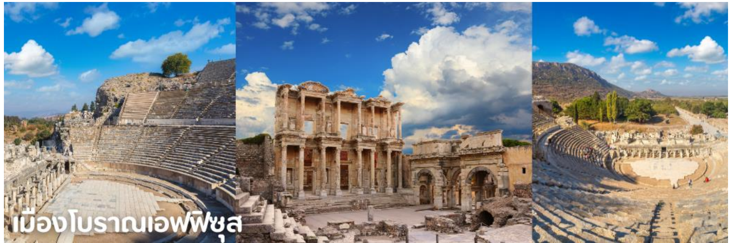
เมืองโบราณเอเฟซุส

จากนั้นนำทุกท่านเข้าชม เมืองโบราณเอเฟซุส เมืองโบราณที่มีการบำรุงรักษาไว้เป็นอย่างดีเมืองหนึ่ง เคยเป็นที่อยู่ของชาวไอโอนิก (Ionia) จากกรีก ซึ่งอพยพเข้ามาปักหลักสร้างเมือง ซึ่งรุ่งเรืองขึ้นในศตวรรษที่ 6 ก่อนคริสต์กาล ต่อมาถูกรุกรานเข้ายึดครองโดยพวกเปอร์เซียและกษัตริย์อเล็กซานเดอร์มหาราช ภายหลังเมื่อโรมันเข้าครอบครองก็ได้สถาปนาเอเฟซุสขึ้นเป็นเมืองหลวงต่างจังหวัดของโรมัน นำท่านเดินบนถนนหินอ่อนผ่านใจกลางเมืองเก่าที่สองข้างทางเต็มไปด้วยซากสิ่งก่อสร้างเมื่อสมัย 2,000 ปีที่แล้ว ไม่ว่าจะเป็นโรงละครกลางแจ้งที่สามารถจุผู้ชมได้กว่า 30,000 คน ซึ่งยังคงใช้งานได้จนถึงปัจจุบันนี้ นำท่านชม ห้องอาบน้ำแบบโรมันโบราณ (ROMAN BATH) ที่ยังคงเหลือร่องรอยของห้องอบไอน้ำ ให้เห็นอยู่จนถึงทุกวันนี้, ห้องสมุดโบราณ ที่มีวิธีการเก็บรักษาหนังสือไว้ได้เป็นอย่างดีทุกสิ่งทุกอย่างล้วนเป็นศิลปะแบบ เฮเลนนิสติกที่มีความอ่อนหวานและฝีมือประณีต