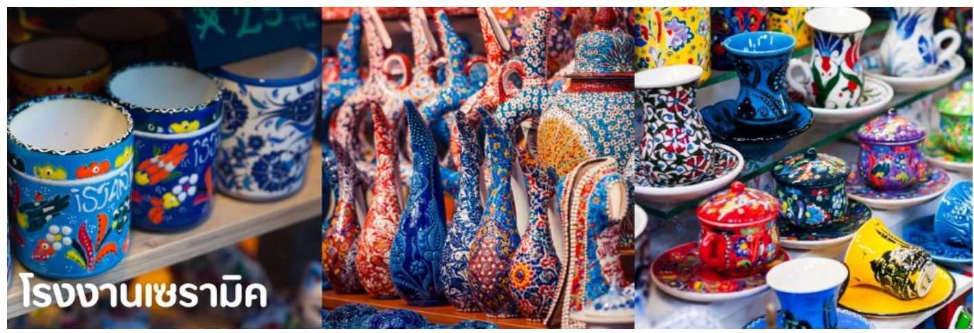
โรงงานเซรามิค

จากนั้นนำท่านแวะ ชมโรงงานจิ๋วเวิร์รี่ โรงงานพรม และโรงงานเซรามิค อิสระกับการเลือกซื้อสินค้าและของที่ระลึก