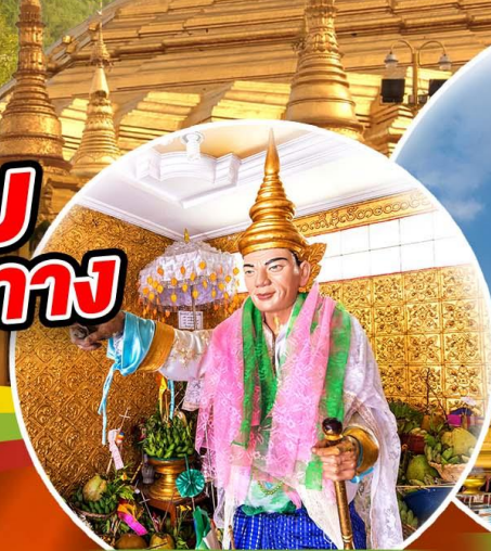
สักการะเทพทันใจ