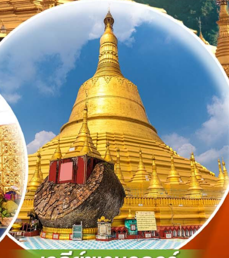
เจดีย์ชเวมอดอร์

สักการะ 3 มหาบุชาสถาน เจดีย์ชเวดากอง เจดีย์โบตาทาวน์ เจดีย์ชเวมอดอร์ พระธาตุอินทร์แขวน