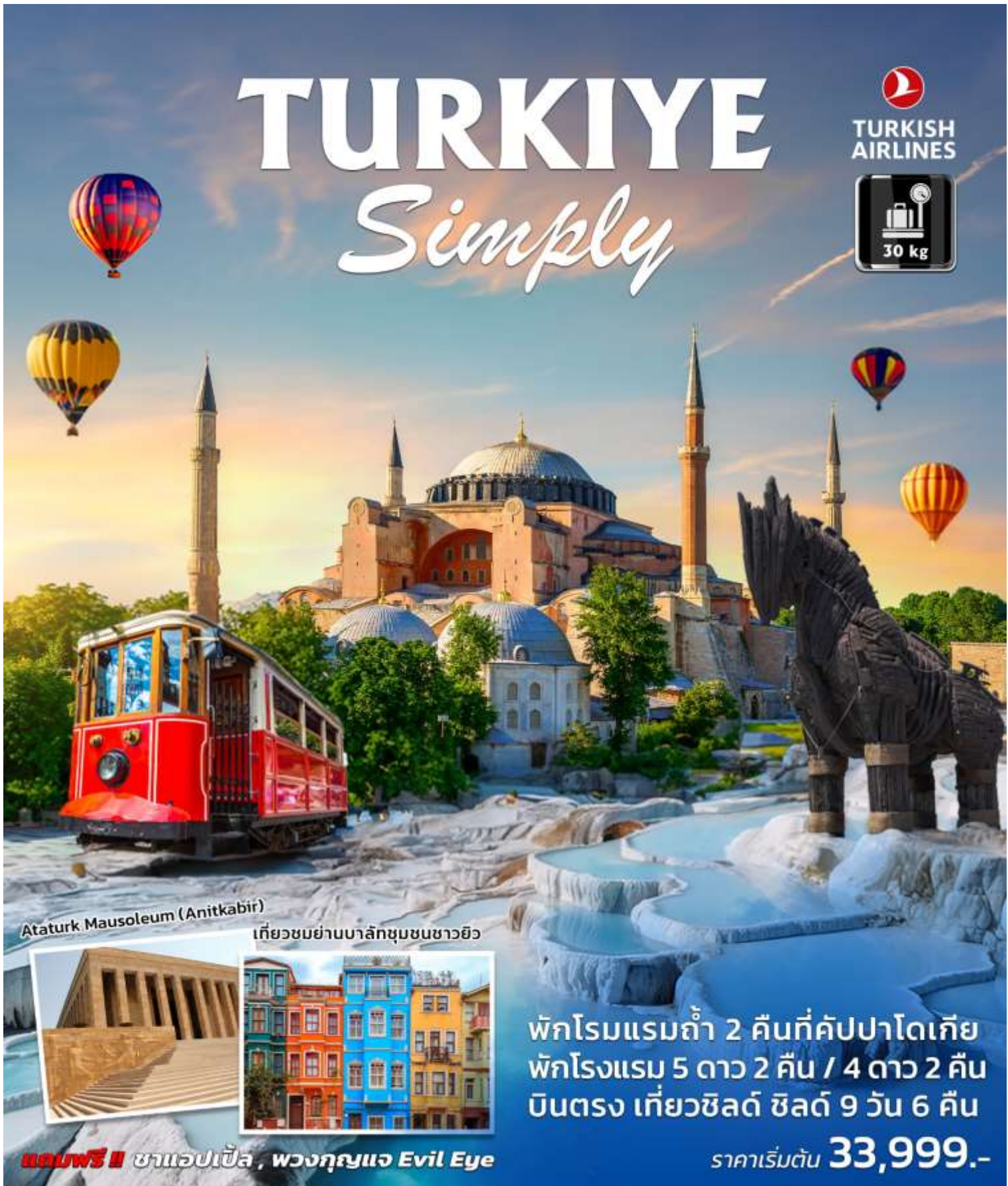
Ataturk Mausoleum (Anitkabir)