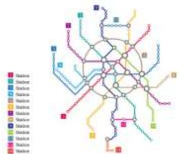
METRO MAP TEMPLATE MOSCOW CITY

พาทุกท่านนั่ง รถไฟใต้ดินมอสโก เพื่อชมความสวยงามของสถานีรถไฟใต้ดินที่ถูกออกแบบ และตกแต่งอย่างสวยงามอลังการ โดยแต่ละสถานีจะมีเอกลักษณ์ที่ต่างกัน ในอดีตสถานีรถไฟใต้ดินเคยถูกใช้เป็นสถานที่หลบภัยจากกองกำลังทหารนาซีในช่วงสงครามครั้งที่ 2 หากนับรวมความยาวของเส้นทางเดินรถไฟใต้ดินทั้งหมดมอสโกจะมีความยาวถึง 260 กิโลเมตร รถไฟใต้ดินทำให้ผู้คนสามารถเดินทางไปไหนมาไหนได้สะดวกกว่าบนถนนทั่วไป สถานีรถไฟใต้ดินเป็นสิ่งก่อสร้างที่ชาวรัสเซียสามารถอวดชาวต่างชาติให้เห็นถึงความยิ่งใหญ่ตลอดจนประวัติศาสตร์ความเป็นชาตินิยมและวัฒนธรรมประเพณีอันสวยงามอันเป็นเสน่ห์ดึงดูดให้นักท่องเที่ยวมาเยี่ยมชมเนื่องจากการตกแต่งของ