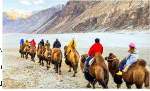
เก๋ งารี ฟื่อ