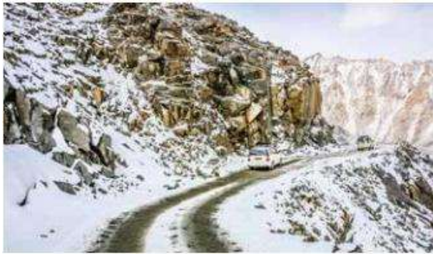
พักค้างคืน

กลางวัน รับประทานอาหาร ณ ภัตตาคารท้องถิ่น (อิสระมื้อกลางวัน)