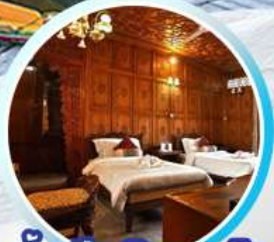
บ้านเรือ..วิมานบนดิน สมัยวิคตอเรีย

9-15 ส.ค. 28 ส.ค.-3 ม.ค.67 29 ส.ค.-4 ม.ค.67 30 ส.ค.-5 ม.ค.67