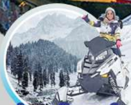
นั่งกระเช้ากุลมาร์ค เล่นหิมะจุใจให้หายคิดถึง