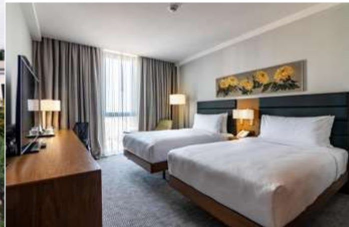
พักที่ Hilton Garden Inn หรือเทียบเท่าระดับ 4 ดาว (3 คืน ***คืนที่1,4,5)