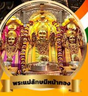
พระแม่ลักษมีหน้าทอง

ไหว้มหาคเณศ 8 ปางมหาขงคล พร้อมองค์ศักดิ์สูงเศรชฐี และองค์สิทรีวินายก