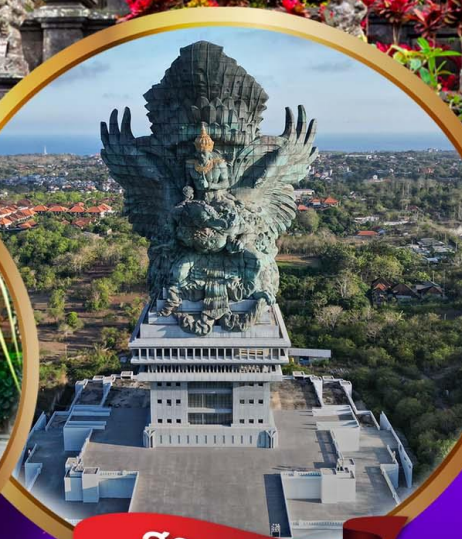
สวนวิชนู