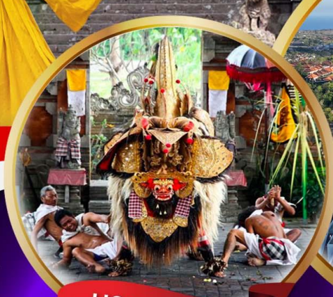
บารองแดนซ์