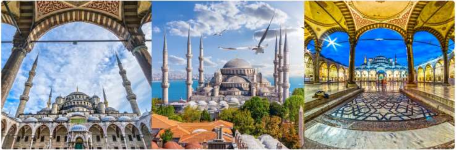
ซึ่งก็คือ Sultan Ahmed นั่นเอง

คนได้เรือนแสน ใช้เวลาในการก่อสร้างนานถึง 7 ปี ระหว่าง ค.ศ.1609-1616 โดยตั้งชื่อตามสุลต่านผู้สร้าง