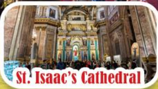
St. Isaac's Cathedral