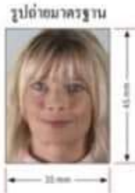
ความยาวต่ำสุดของรูปถ่าย